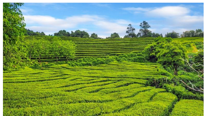
Teeplantage bei Gorreana auf der Insel São Miguel

Am Morgen erfolgt der Transfer zum Flughafen und der Rückflug von Lissabon nach Wien. (F)