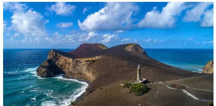
Vulcão dos Capelinhos

Nach dem Frühstück präsentiert uns ein Rundgang durch Angra do Heroísmo die zahlreichen Sehenswürdigkeiten der Hauptstadt von Terceira, die seit 1983 zum UNESCO-Weltkulturerbe zählt. Damit trug man der bedeutsamen Geschichte und dem jahrhundertealten historischen Erbe der Stadt Rechnung. Beim Spaziergang durch die Altstadt ist die einstige politische, wirtschaftliche und religiöse Bedeutung der Inselhauptstadt gut spürbar. Prachtige Renaissancebauten, Paläste, Herrenhäuser, alte Klöster und Kirchen in der historischen Altstadt sind Zeugnis dieser Zeit und machen das besondere Flair aus. Am Nachmittag Flug von Terceira nach Lissabon und Transfer zum Hotel. (F)