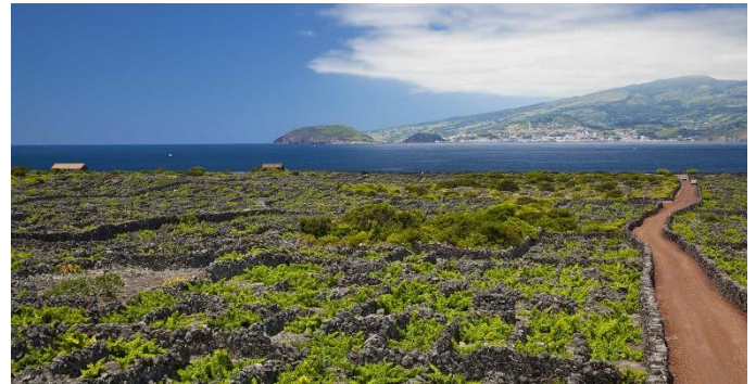
Weinanbau auf Pico