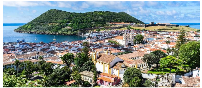
Angra do Heroísmo