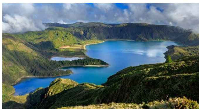
Lagoa do Fogo